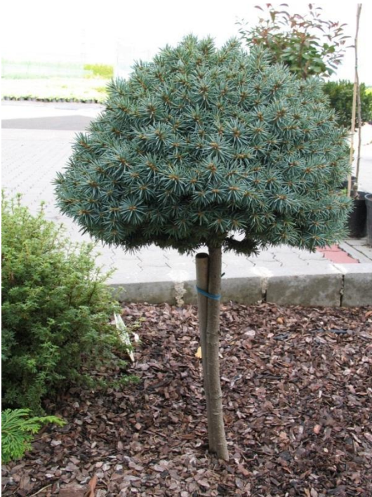
Picea pungens PALI