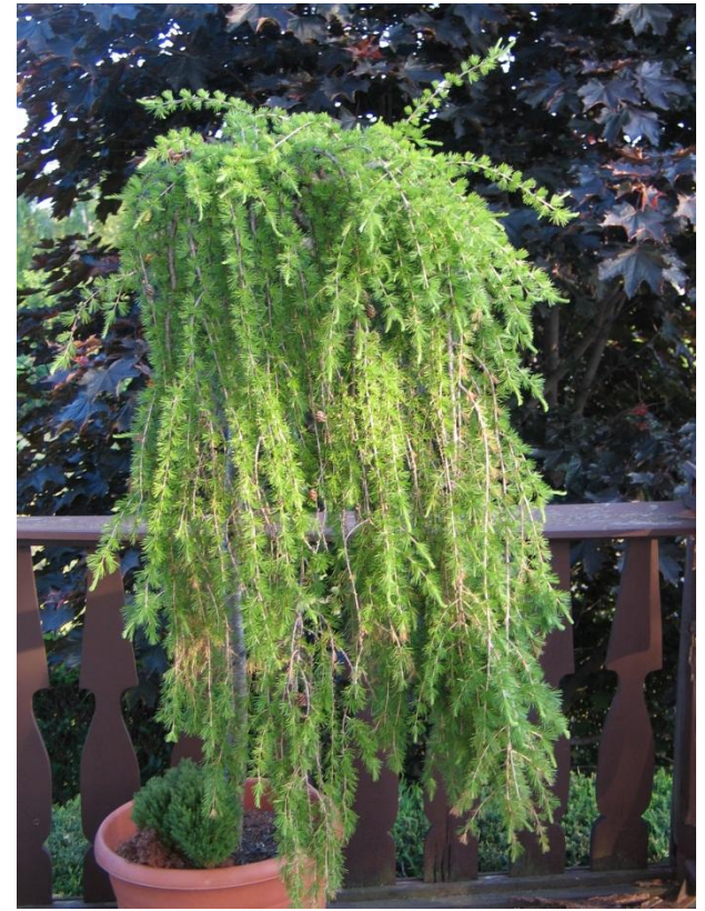
Larix decidua PULI