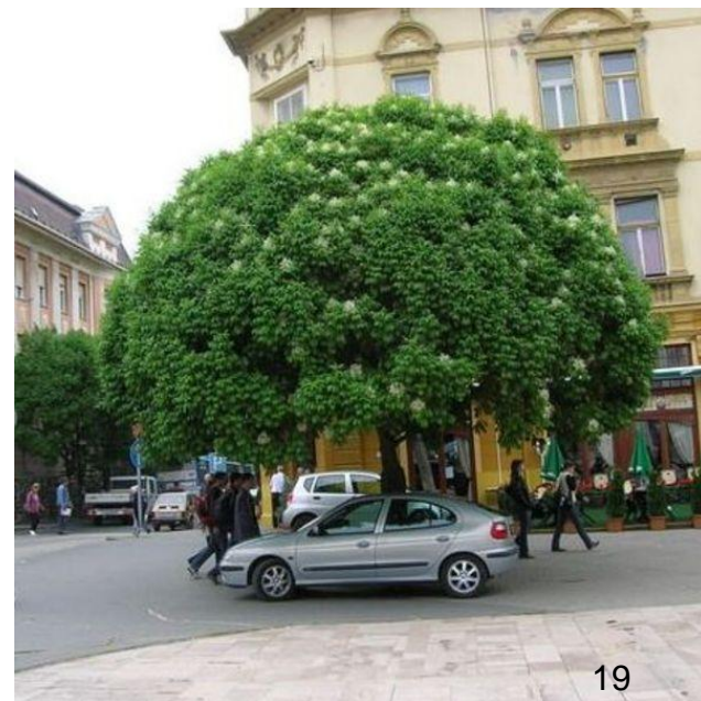
Fraxinus ornus MECSEK